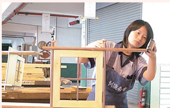
▲ 創意傢俱設計及製作。

青年就業情勢雖然較其他年齡層為不易，但是青年待業週期也較其他年齡層的勞工短，因此，於青年在校期間、未進入職場前、與初進職場的階段，提供適性的協助與輔導，可縮短尋職時間，並輔以產業發展的調整以及地方產業的合作，增加就業機會，以積極解決我國青年就業問題。🌀