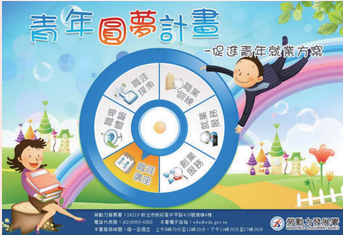
◀ 青年圓夢計畫—促進青年就業方案資訊平臺

問題，提出跨部會促進青年就業策略及具體措施，涵蓋強化職涯扎根功能、增進工作技能與共通核心職能、促進職場體驗、產業結構調整或地方產業發展、排除就業障礙、待業青年就業服務等面向，協助青年從職涯歷程中培養兼具彈性、創新與職能轉換能力。