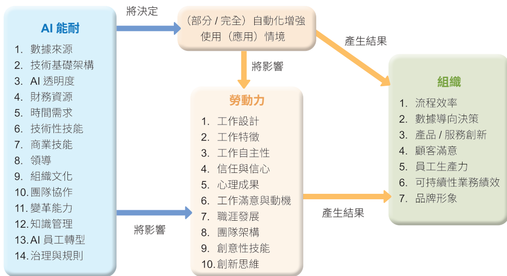
▲ 圖2：人力資源的數位轉型準備 (Chowdhury et al., 2023)

位轉型，圖2 為他們所提出的架構。他們 指出組織應先討論人工智慧如何在組織人 力資源管理功能及流程上的應用及可能結 果（例如工作設計、強化組織互信等等）， 並向前找出數位技術、人力資本、社會資 本及財務資源等等各項組織資源，而這些 組織資源代表了定義組織將如何運用數位 技術的方式及類型（例如完全自動化、或 用於增強和輔助人類工作），而這個架構 也提出了與前述可能的組織績效的關聯。 他們也指出，如果組織完整規劃整體數位 技術策略，做好人工智慧相關的知識創建 和傳播，並且為開發員工的技能、知識和 專業知識做好準備，讓工作者在與數位科 技協作時，提供角色清晰度，並培養人類 工作者的信任和信心，增強他們與人工智 慧科技的情感參與，同時數位轉型能更大 幅地推動組織知識共享，使組織能跨越內 部藩籬；並使更多人得以重複使用知識，