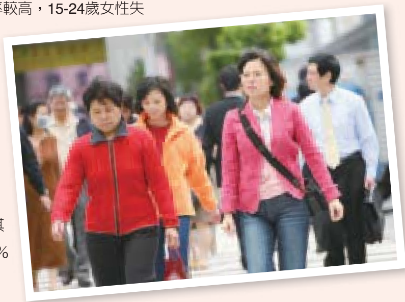
女性因婚育因素退出職場後，復出工作的比率較低，勞參率隨年齡增長而降低。

業率為12.66%，男性為13.60%，主要因青少年從學校轉換到職場，較缺乏工作經驗，需一段調適學習過程，或因較無家庭經濟負擔，勞動條件不符工作滿意度時，不願低就，導致其就業穩定性較低，其餘各年齡層失業率在6.23%以內。