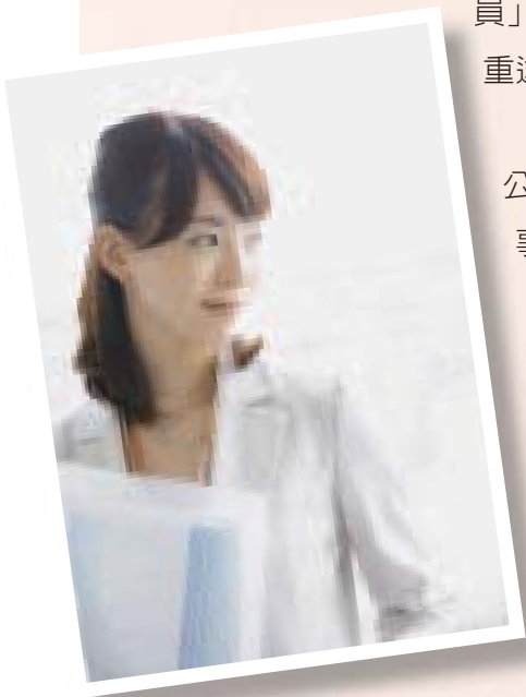
女性多從事事物服務與售貨工作。

進一步分析大職類下之各中職業，女性就業者在「辦公室事務人員」、「行政助理專業人員」及「顧客服務事務人員」三項職業，所占比重 7成7以上 ；男性就業者在「駕駛員及移運設備操作工」、「保安服務工作人員」、「採礦工及營建工」及「金屬、機具處理及製造有關工作者」四項職業，所占比重達 9成6以上 。因傳統刻板印象、教育、職業訓練，以及兩性生理與心理上的差異，致兩性對職業偏好有異，產生就業職業的差異，勞動市場要注意的是能提供性別平等就業環境，摒棄因性別因素而產生的就業障礙。