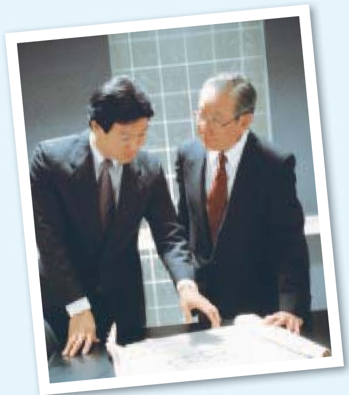
為努力幫助中高齡者就業，南韓政府於今年（2011）推出「工作時間本位的工資高峰制度」。

南韓就業暨勞動部另有兩個具特色的外圍組織——專業化的R&D機構——KRIVET（Korea Research Institute for Vocational Education and Training）——該單位直屬於總理並由就業暨勞動部與教育部共同出資，密切合作，為韓國職業教育與職業訓練政策發展方向奠定基礎；就業暨勞動部另設有一綜合性人力資源發展單位——HRDKorea負責執行終身職能發展、職業訓練、技能檢定、技能競賽、外勞審核、國際合作及海外就業等業務，使得政策規劃與業務執行，可發揮更大的行政績效。☉