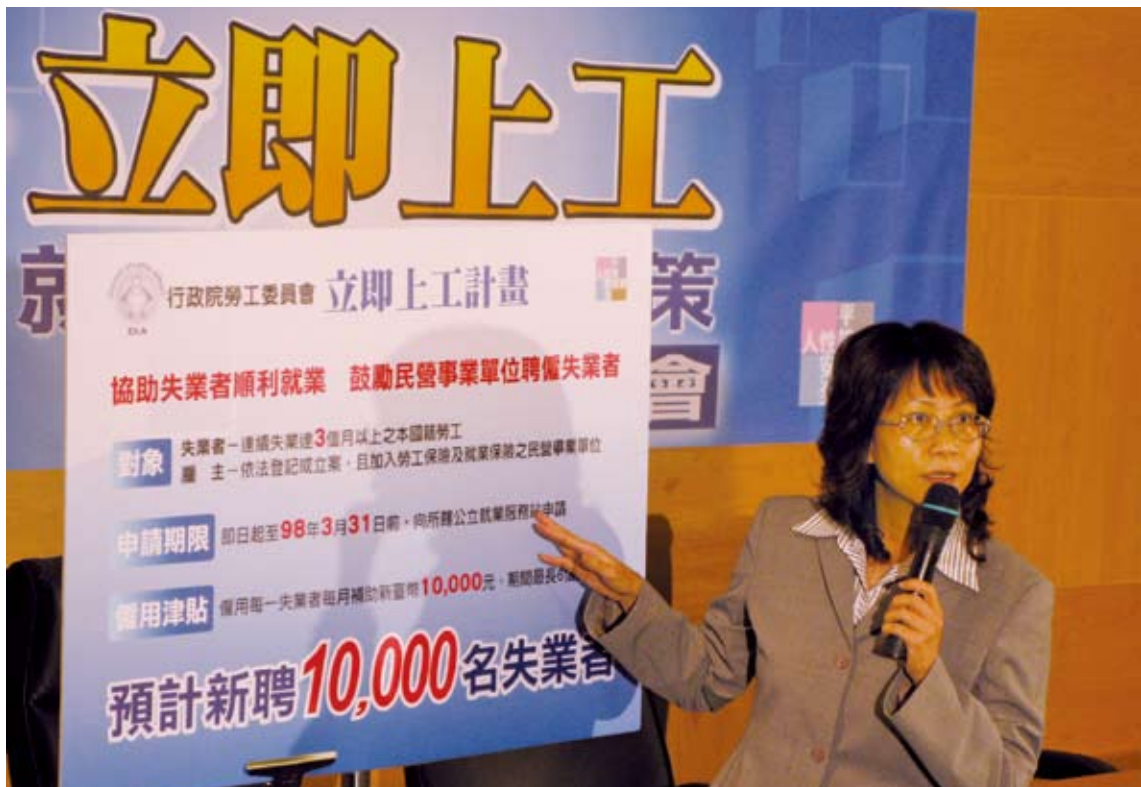
↑ 97 年 10 月 22 日「立即上工就業促進政策」記者會