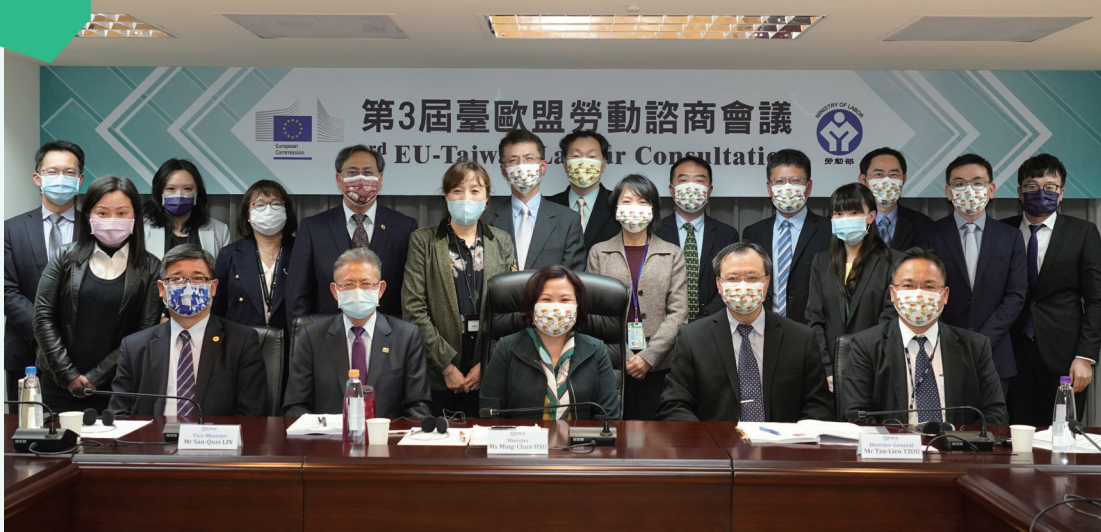
勞動部長許銘春帶領同仁與會

本（第3）屆臺歐盟勞動諮商會議於臺北時間110年2月3日下午4時以視訊方式舉辦，歐盟由歐洲聯盟執行委員會就業、社會事務及融合總署（DG-EMPL，以下簡稱歐盟執委會就業總署）總署長Joost KORTE親率同仁及歐洲職業安全衛生局（EU-OSHA）代表參加，我國則由勞動部長許銘春帶領同仁與會，雙方駐外代表－歐洲經貿辦事處長高哲夫及駐歐盟兼駐比利時代表處大使蔡明彥，亦共同參與雙邊會談及開幕式，與會者互動熱絡。