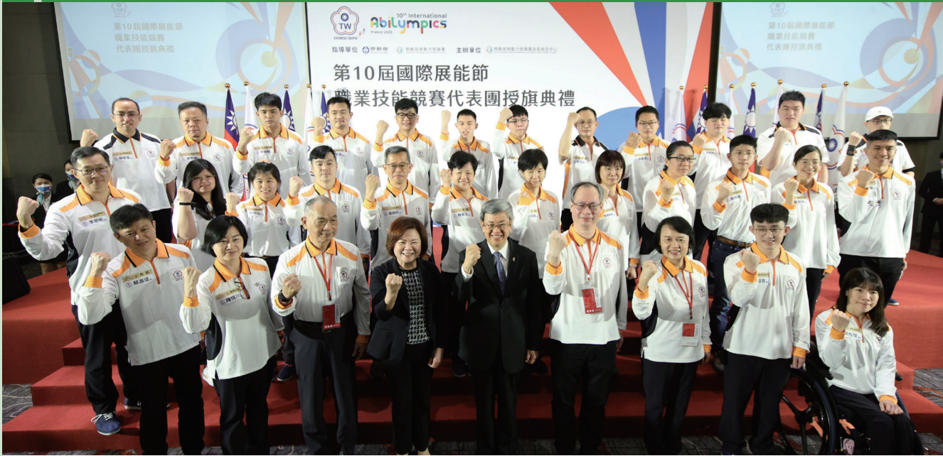
▲ 行政院長陳建仁、勞動部長許銘春及第 10 屆國際展能節職業技能競賽國手於授旗典禮合影