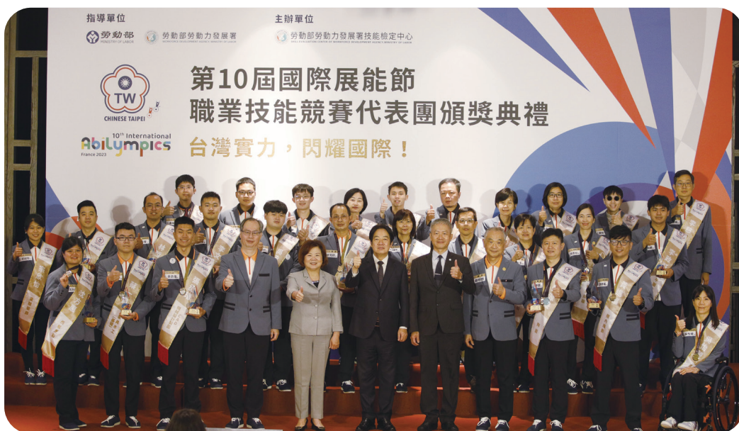
▲ 副總統賴清德、勞動部長許銘春、出席長官及貴賓與第 10 屆國際展能節職業技能競賽國手於頒獎典禮合影

為了替前往法國的國手及培訓團隊加油打氣，行政院長陳建仁於 2023 年 3 月 20 日親自蒞臨授旗典禮，陳院長在致詞時表示，為了讓國手可以盡情展現優異的技能，政府持續投入相關資源，台上十分鐘，台下十年功，因為國手孜孜不倦的付出，才能在競賽場上發光發熱，為國爭光。