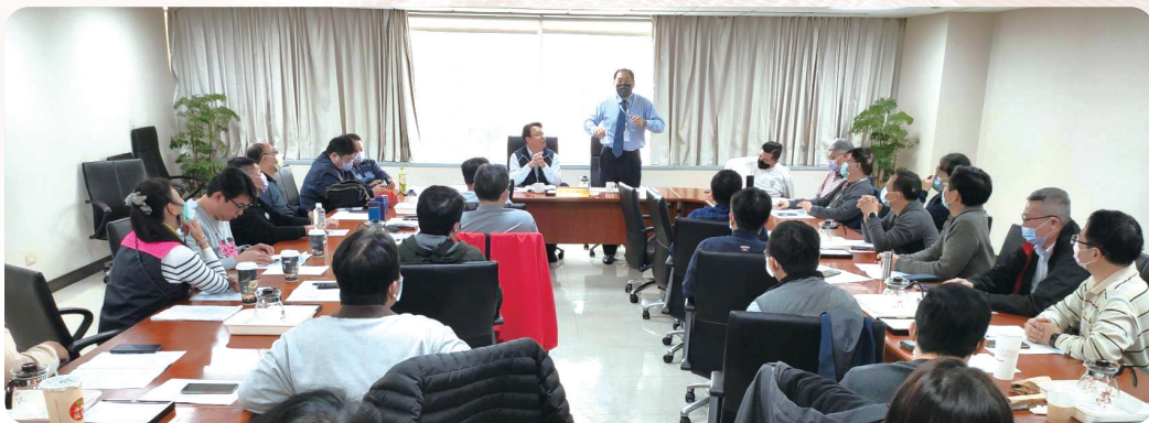
▲ 事業單位代表人及主管機關首長與幹部座談