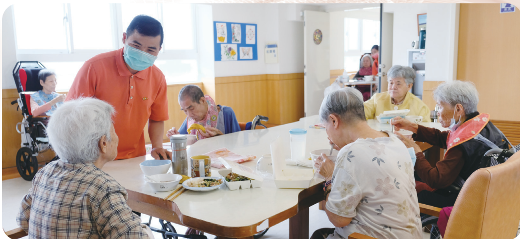
▲ 偉文四真心照顧長者，深得人心

手打到照服員，但這時候就要靜下心來安撫病人情緒，降低不安、持續關心需求、跟他溝通，等到病人恢復平靜就可以繼續完成照護工作。他並以成熟溫柔的方式與長輩互動與溝通，在照顧上更得到家屬及長輩的信任與認同，家屬很放心的把家人給他照顧，也是家屬長輩間頻頻對其豎起大拇指的照服員。