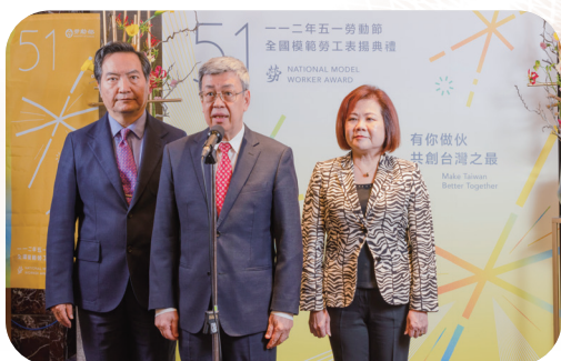
▲ 行政院長陳建仁（中）、行政院政務委員羅秉成（左）、勞動部長許銘春（右）對模範勞工與移工的貢獻讚揚肯定

醫院」，並持續推動「移工留才久用方案」及調漲基本工資，以及因應人口快速老化及少子女化造成的勞保年金財務問題，政府也積極編列相關預算，持續撥補挹注基金等，都是為了建構更安全、安穩的勞動環境，使勞工朋友們能安心的打拼。