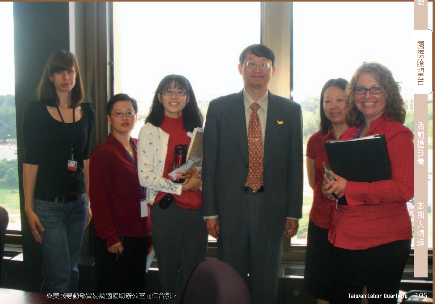
與美國勞動部貿易調適協助辦公室同仁合影。