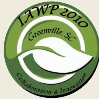
年會標章，會議主題為“合作與創新”。